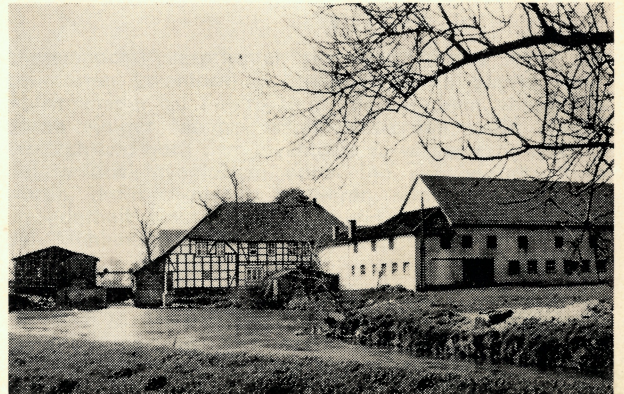
Die Leinemühle bei Northeim