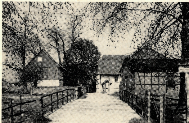
Einfahrt zur Leinemühle bei Northeim/Hann.